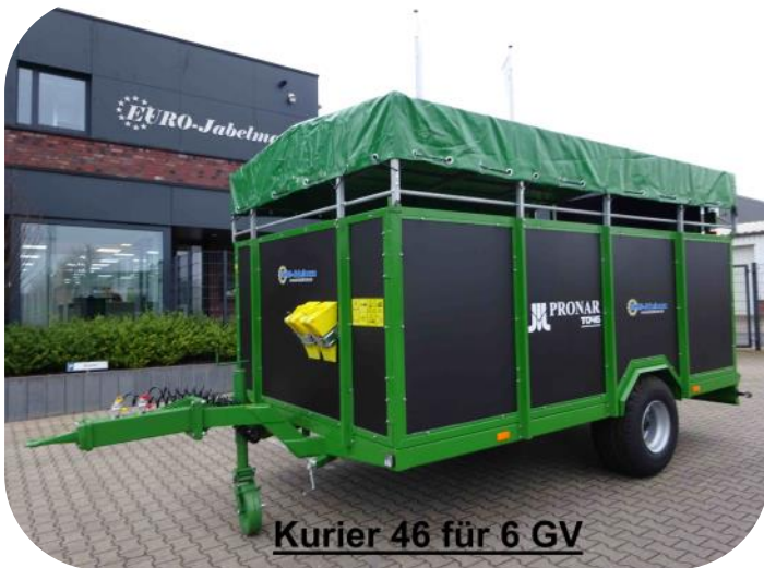
Kurier 46 für 6 GV