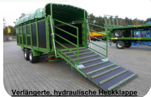
Verlängerte, hydraulische Heckklappe

Alle Preise zzgl. MwSt ab Lager Itterbeck, bei Anlieferung zzgl. Frachanteil Preise gültig ab 01/2023