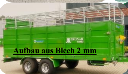
Aufbau aus Blech 2 mm