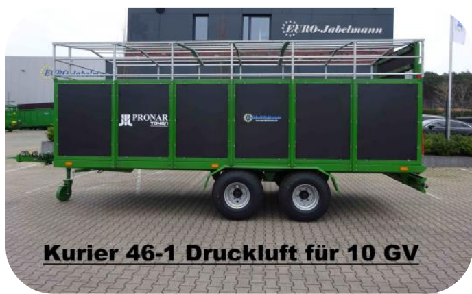
Kurier 46-1 Druckluft für 10 GV