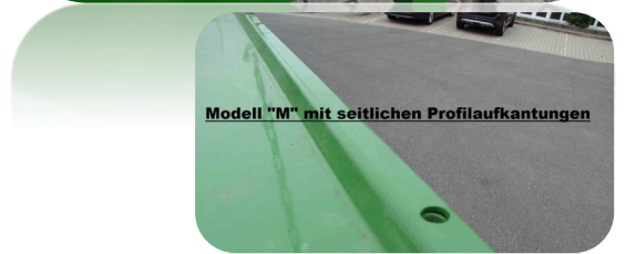
Modell "M" mit seitlichen Profilaufkantungen