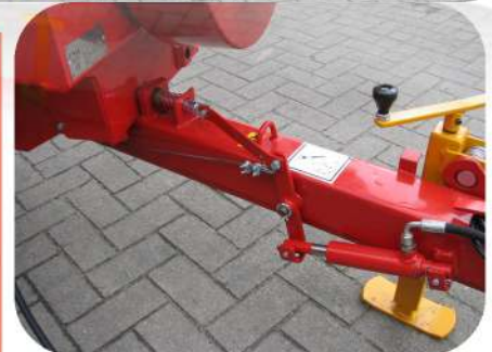
Wickeleinheit Firma Raaspe

Alle Preise zzgl. MwSt ab Lager Itterbeck Preise gültig ab 01/2024