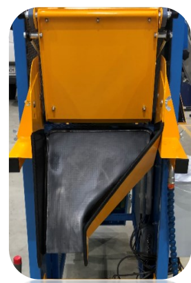
Sondertrichter für Papiertüten