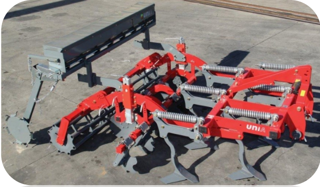
Alfa 220/8/3 mit Leitblechen