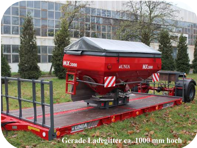
Gerade Ladegitter ca. 1000 mm hoch