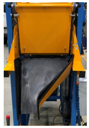
Sondertrichter für Papiertüten