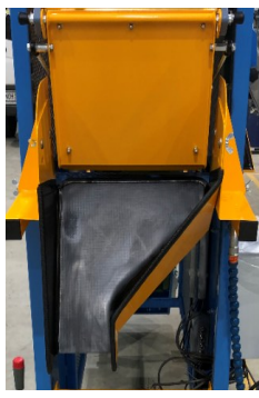
Sondertrichter für Papiertüten