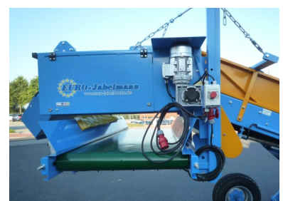
Mit Spiralerterder und Austragband