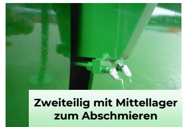
Zweiteilig mit Mittellager zum Abschmieren

Preise zzgl. MwSt ab Lager Itterbeck, gültig ab 10/2025