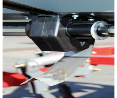
Alfa 220/8/3 mit Leitblechen