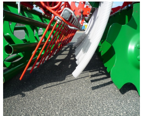
Alfa 550/25/3 mit Rührwelle