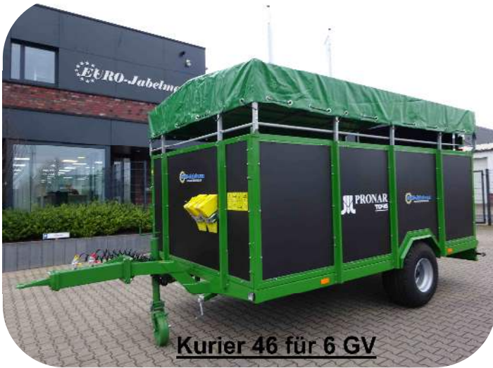
Kurier 46 für 6 GV