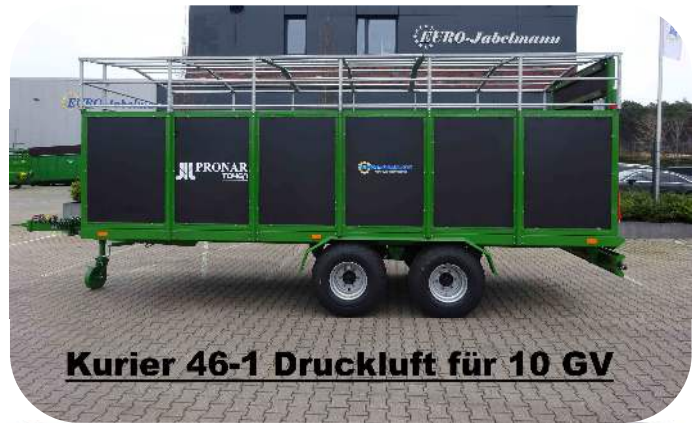
Kurier 46-1 Druckluft für 10 GV