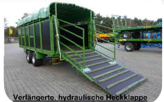
Verlängerte, hydraulische Heckklappe

EURO-JABELMANN Maschinenbau GmbH Wilsumer Str. 19 - 21 D-49847 Itterbeck Tel. 0049(0)5948-9339-0 info@euro-jabelmann.de www.euro-jabelmann.de