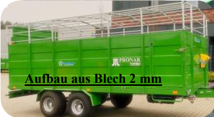
Aufbau aus Blech 2 mm