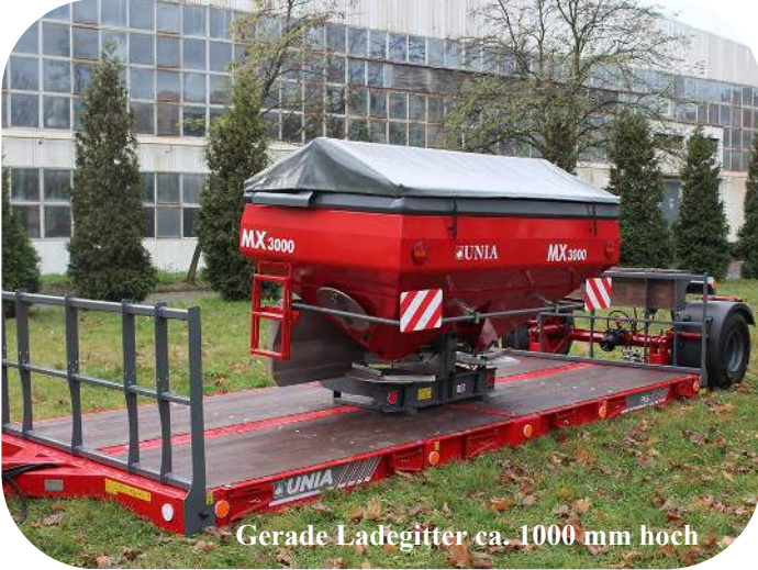
Gerade Ladegitter ca. 1000 mm hoch